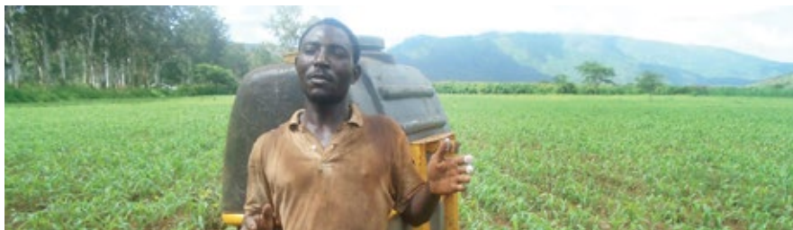
Préparation d'un traitement insecticide d'une exploitation de COCENOUN